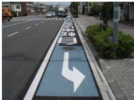
青色のが自転車レーンとなります

なお、自転車レーン青色に着色し、歩行者の安全性向上のために路肩を着色する際は緑色として整備を進めているとの事です。静岡市では、今後も自転車道ネットワークの整備を進めていくとの事です。第一建設も郷土静岡における良質な社会資本整備を担う一員として今後も自転車道ネットワークの構築に貢献していきたいと考えております。おわりに、施工中は近隣の皆様並びにご通行の皆様にご迷惑をおかけいたしました、無事に完成することが出来ました。ご協力ありがとうございました。